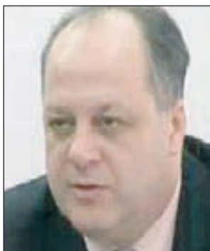
Hadžović: Široke reforme

BiH, zajedno sa Crnom Gorom, Gruzijom i Makedonijom, označava aspirantom na ulazak u NATO. Također, naša država kvalificira se kao ona koja ispunjava uvjete za primanje američke pomoći za priključenje NATO-u. Lugar je pozvao američkog predsjednika Baraka Obama (Barack) da osi-