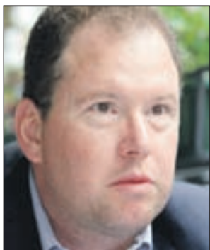
Basiner: Optimističan scenarij

U ovom zakonskom rješenju, naime, prvi put se