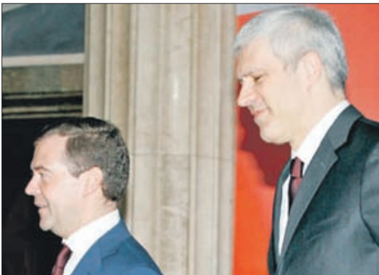
Ruski i srbijanski predsjednik: Utvrđuje se program posjete

Datum posjete određen je godišnjicom oslobođenja Beograda. Ali, teško je da će bilo ko prihvatiti da se u tim politički krugovima stvari događaju slučajno. Rusija se drži po strani u butmirskim razgovorima, što, naravno, ne mora značiti da se Moskva ne pita i da se neće pitati. Posjeta je jasan signal da je Rusiji ovaj region vrlo važan, a u njemu Srbija i Beograd na-