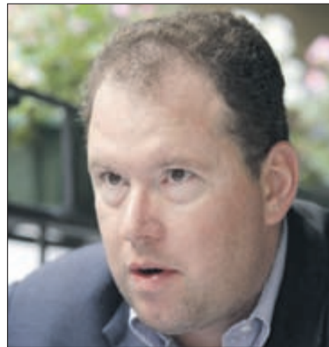
Basiner: Nema političke volje

Milošević, Tuđman i Izetbegović nisu među živ-