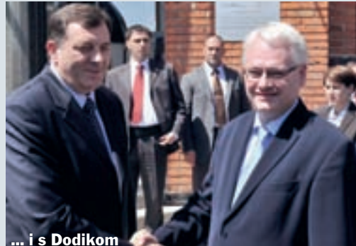
... i s Dodikom

WEBER: To je intimna pozicija njemačke kancelarke Merkel kao i konzervativnih snaga u Evropi. Ta pozicija će jačati s aktualnom krizom u EU. No, s