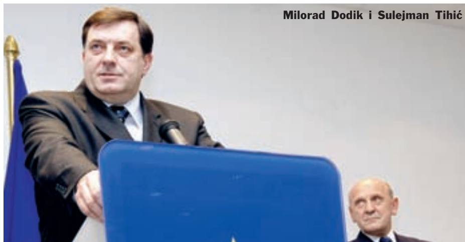
Milorad Dodik i Sulejman Tihic