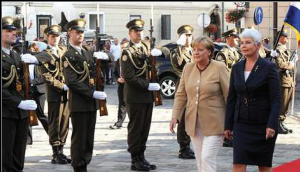
KANCELARKA U ZAGREBU...