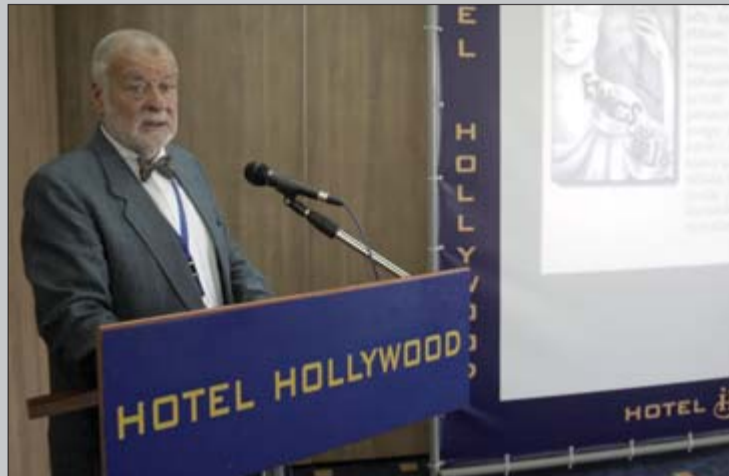
Sa jučerašnjeg otvorenja u Sarajevu